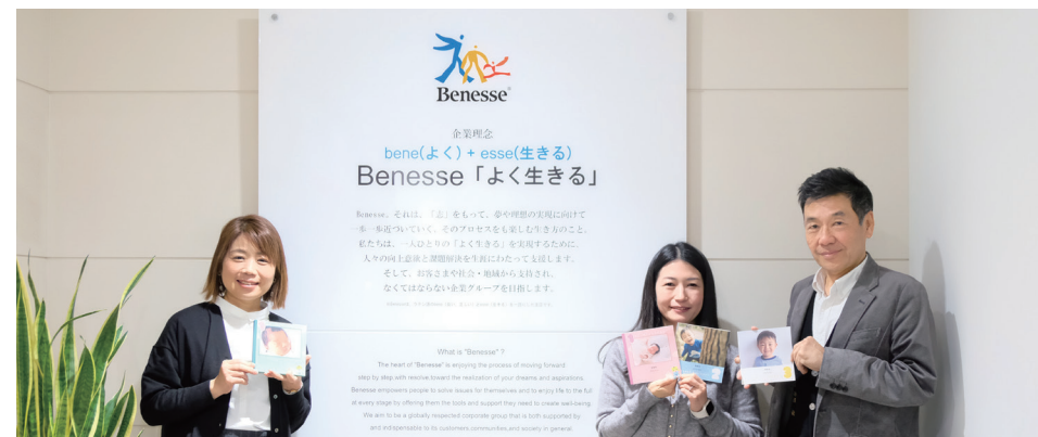
しまじろう