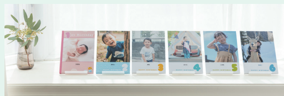
しまじろう